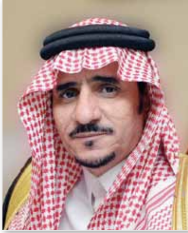
معالي أ.د. عبدالله بن يحيى الحسين