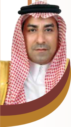
بقلم: د. رأفت إسماعيل بدر

ومواكبة من المؤسسة لهذه الثقل الحضارية في صناعة الخدمة فقد عكف مجلس إدارة المؤسسة بعد أن تمت إعادة تشكيله ونال - معظم أعضاء المجلس - ثقة صاحب المعالي وزير الحج والعمرة الدكتور / محمد صالح بن طاهر بنتن في التمديد لمدة عام.. على العمل ليلاً ونهاراً، من أجل إتمام عملية التحول المؤسسي للمؤسسة بالاستعانة ببيت خبرة عالمي متخصص، وكذلك استكمال كافة الاستعدادات والتجهيزات، بالإضافة إلى الانتهاء