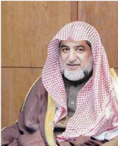
معالي الشيخ صالح بن عبدالعزيز آل الشيخ