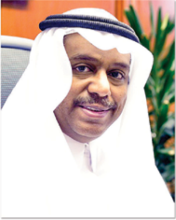
ڈاکٹر عبدالفتاح بن سلیمان مشاط نائب وزیر حج و عمرہ

مؤثر انتظام کے ذریعے سب کے حصہ داری کو یقینی بنایا جائے۔