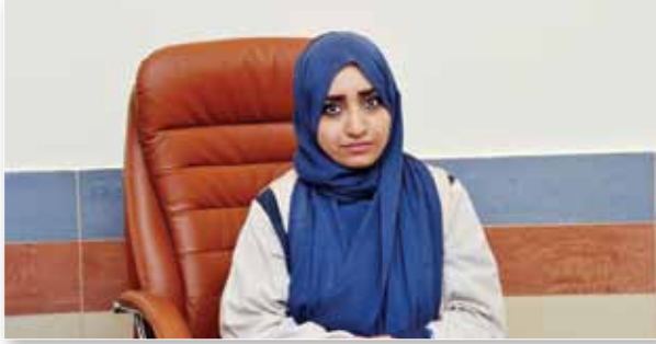
نجدو جمال الليل: