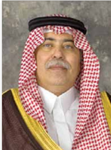
د. ماجد القصبي - وزير التجارة والاستثمار

والبداية كانت مع صاحب السمو الملكي الأمير سعود بن نايف بن عبدالعزيز أمير المنطقة الشرقية الذي أرسل بتاريخ ١٤٢٩/٦/٩هـ خطاب شكر إلى الدكتور رأفت بن إسماعيل إبراهيم بدر رئيس مجلس إدارة مؤسسة مطوية حجاج جنوب آسيا، جاء فيه ما يلي: " تلقينا خطابكم المتضمن إهداءنا نسخة من مجلة (الأهلة) العدد الخامس والثلاثين الصادرة عن مؤسسة مطوية حجاج دول جنوب آسيا".