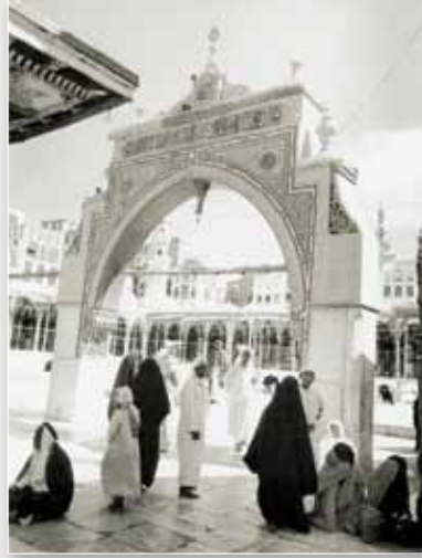
موضع باب بني شيبه

• نشرت في موسوعة مكة المكرمة والمدينة المنورة