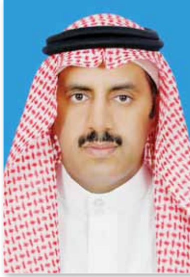
د. فالح السلمي - مدير جامعة الملك خالد