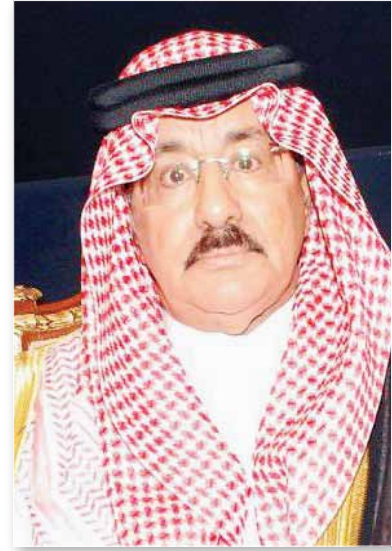
معالي أ. عبدالرحمن السدحان - المستشار بالديوان الملكي