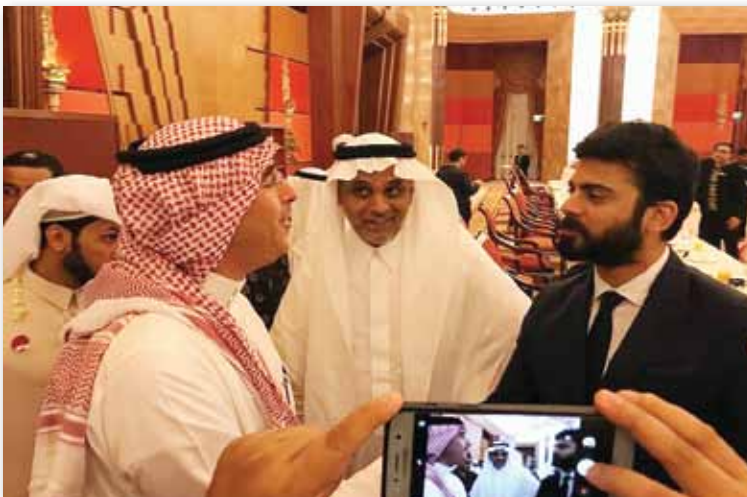
مع معالي وزير الإعلام عواد العواد