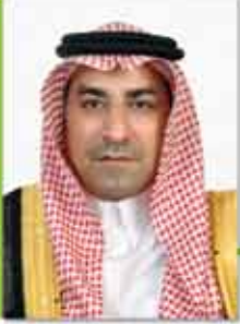
بقلم: د. رافت بن إسماعيل إبراهيم بدر •