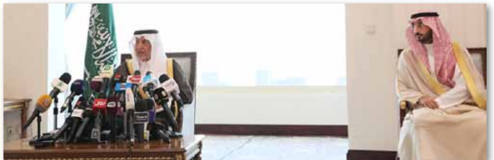
التفاصيل ص ٣

سيتم مساعدتهم على تصحيح الأوضاع لترقى للمستوى المتوقع منها