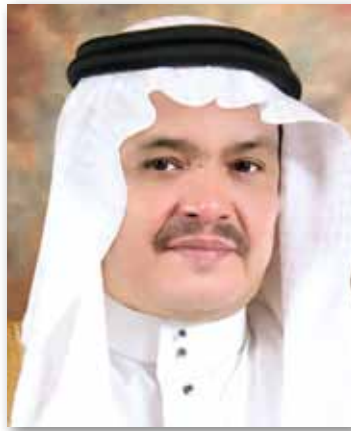
معالي وزير الحج والعمرة