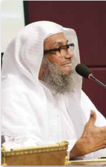
الشيخ خالد النهاري