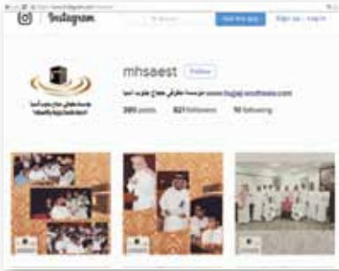
موقع مؤسسة جنوب آسيا على "انستغرام"