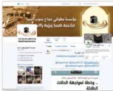
موقع مؤسسة جنوب آسيا على "تويتر"