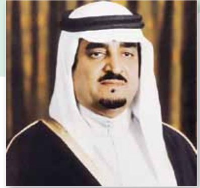
الملك فهد بن عبدالعزيز

أرحب وسط عالم يموج بالتغيرات والتقلبات الحادة. وتمثل هذا الحراك في إعادة هيكلة الدولة والتي بدأت يصدر الأوامر الملكية التي ألغت نحو ١٢ مجلساً ولجنة، وتم إنشاء مجلسين جديدين يرتبطان تنظيمياً بمجلس الوزراء هما: مجلس الشؤون السياسية والأمنية برئاسة سمو ولي العهد الأمير محمد بن نايف بن عبدالعزيز، ومجلس الشؤون الاقتصادية والتنمية برئاسة سمو ولي العهد الأمير محمد بن سلمان ابن عبدالعزيز.. وقد نتج عن ذلك بلورة رؤية المملكة ٢٠٣٠ حيث وافق مجلس الوزراء (أبريل ٢٠١٦م) برئاسة خادم الحرمين الشريفين على ذلك المشروع الإستراتيجي العملاق (رؤية ٢٠٣٠)، والتي تمثل أهداف المملكة في التنمية والاقتصاد ١٥ سنة مقبلة.