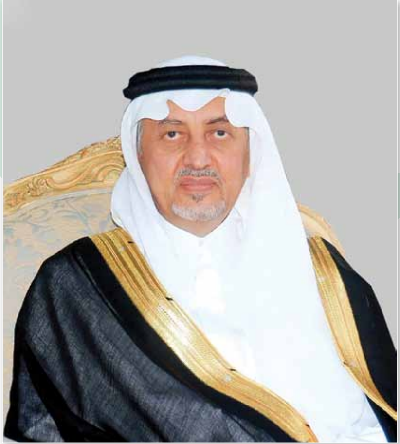
سمو أمير منطقة مكة المكرمة

كما اعتمدت الوزارة الاستعدادات الخاصة في لجنة الطوارئ بالحج، وآلية تطوير عمل الطوارئ من خلال تقسيمها إلى ثلاثة محاور: محور المنطقة المركزية، محور المشاعر المقدسة في عرفات ومنى ومزدلفة، ومحور مكة المكرمة، بالإضافة إلى مساهمة القوى العاملة الزائرة في التخصصات النادرة من خارج الوزارة في تخصصات الطوارئ، والعناية المركزة، والحروق، من الكوادر الطبية والتمريضية.