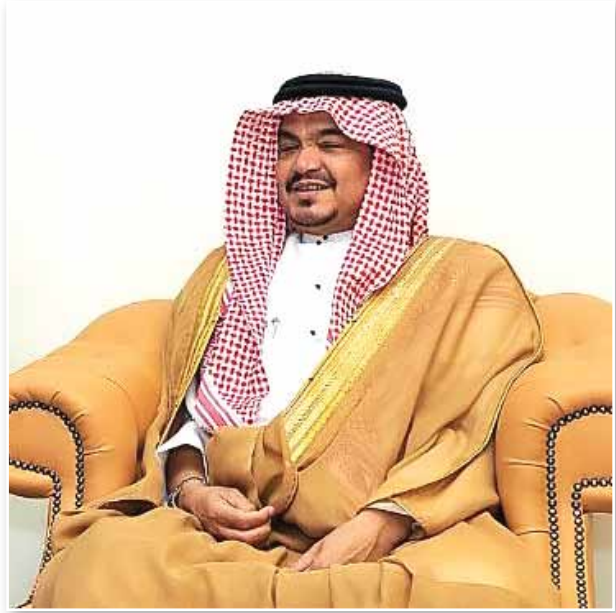
معالي وزير الحج والعمرة