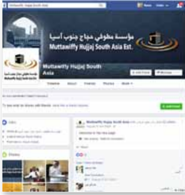
موقع مؤسسة جنوب آسيا على "فيس بوك"