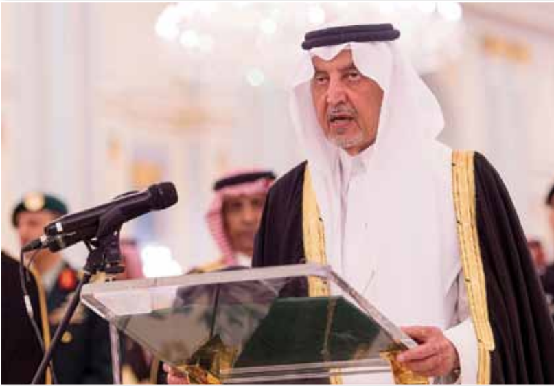
سمو الأمير خالد الفيصل