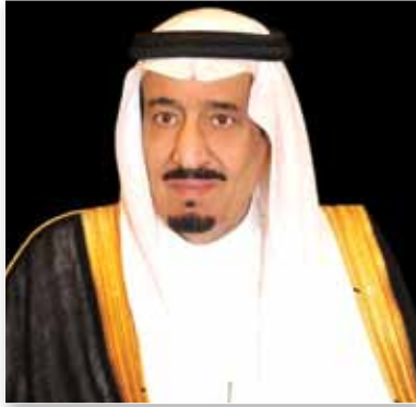
الملك سلمان بن عبدالعزيز