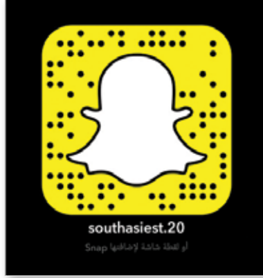
موقع مؤسسة جنوب آسيا على "سناپ شات"