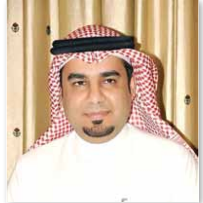
أ. عمر أكبر عضو مجلس إدارة المؤسسة