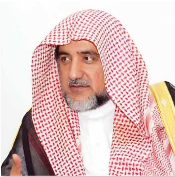
معالي وزير الشؤون الإسلامية والدعوة والإرشاد