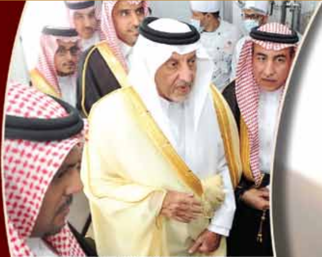
المؤتمر الصحفي لتدشين حملة الحج عبادة وسلوك حضاري ١٤٣٧ هـ

مجلة ثقافية إعلامية فصلية تصدرها مؤسسة مطوفي حجاج جنوب آسيا