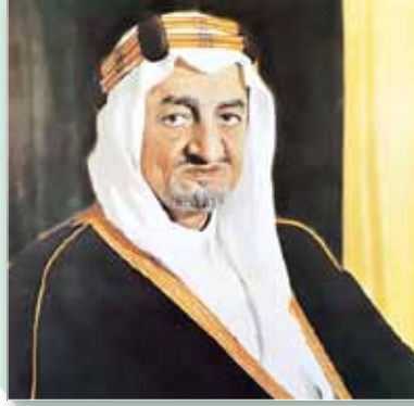
الملك فيصل بن عبدالعزيز