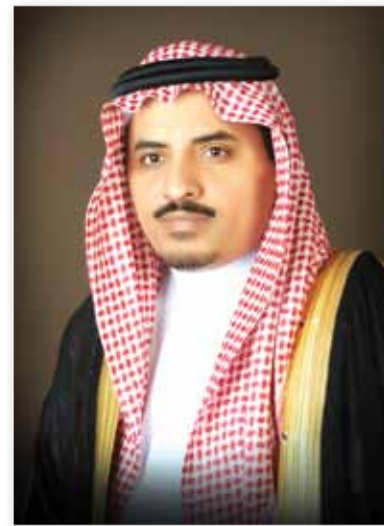
معالي الدكتور عبدالرحمن بن حمد الداود

فيها، وإذ أشكر لكم ذلك، فإنني أسأل الله لكم التوفيق والسداد.