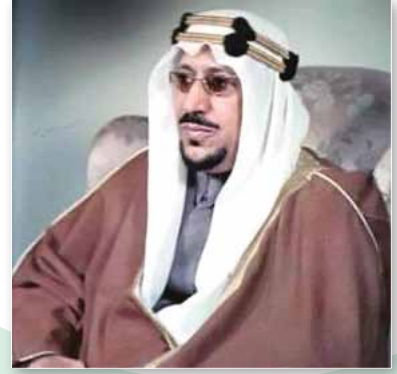
الملك سعود بن عبدالعزيز