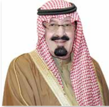
الملك عبدالله بن عبدالعزيز