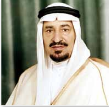
الملك خالد بن عبدالعزيز