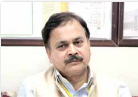
السفير أحمد جاويد

الملك سلمان بن عبدالعزيز وقبل ستة أشهر زار رئيس الوزراء الهندي الرياض والتقى الملك سلمان بن عبدالعزيز والمسؤولين في المملكة العربية السعودية.