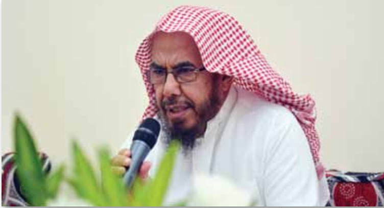
فضيلة الدكتور الشيخ عبد الله المطلق يلقي محاضرة داخل المخيم بمنى لضيوف حملة خادم الحرمين الشريفين