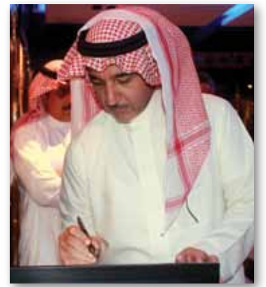
معاليه يوقع في دفتر الزيارات

وأضاف فضيلته: "عشنا أياماً كريمة ضمن حملة الشؤون الخاصة لخادم الحرمين الشريفين التي تشرف عليها الشؤون الخاصة لخادم الحرمين الشريفين، والتي تضم رجالاً خدموا في سبيل الله ودلوا الصعاب لوفد الله"، مبيناً فضيلته أن عدد حجاج حملة خادم الحرمين الذين يتبعون مؤسسة مطوية حجاج دول جنوب آسيا يبلغ ٢,٢٢٠ حاجاً من جنسيات مختلفة ويرأس الحملة الأخ الكريم صاحب المعالي رئيس الشؤون الخاصة لخادم الحرمين الشريفين الدكتور حازم بن مصطفى زقزوق، مؤكداً أنه جزاء الله خيراً خدم المجموعة واقفاً على رجليه متابعاً لكل كبيرة وصغيرة وبذل قصارى جهده من أجل راحة الحجاج.