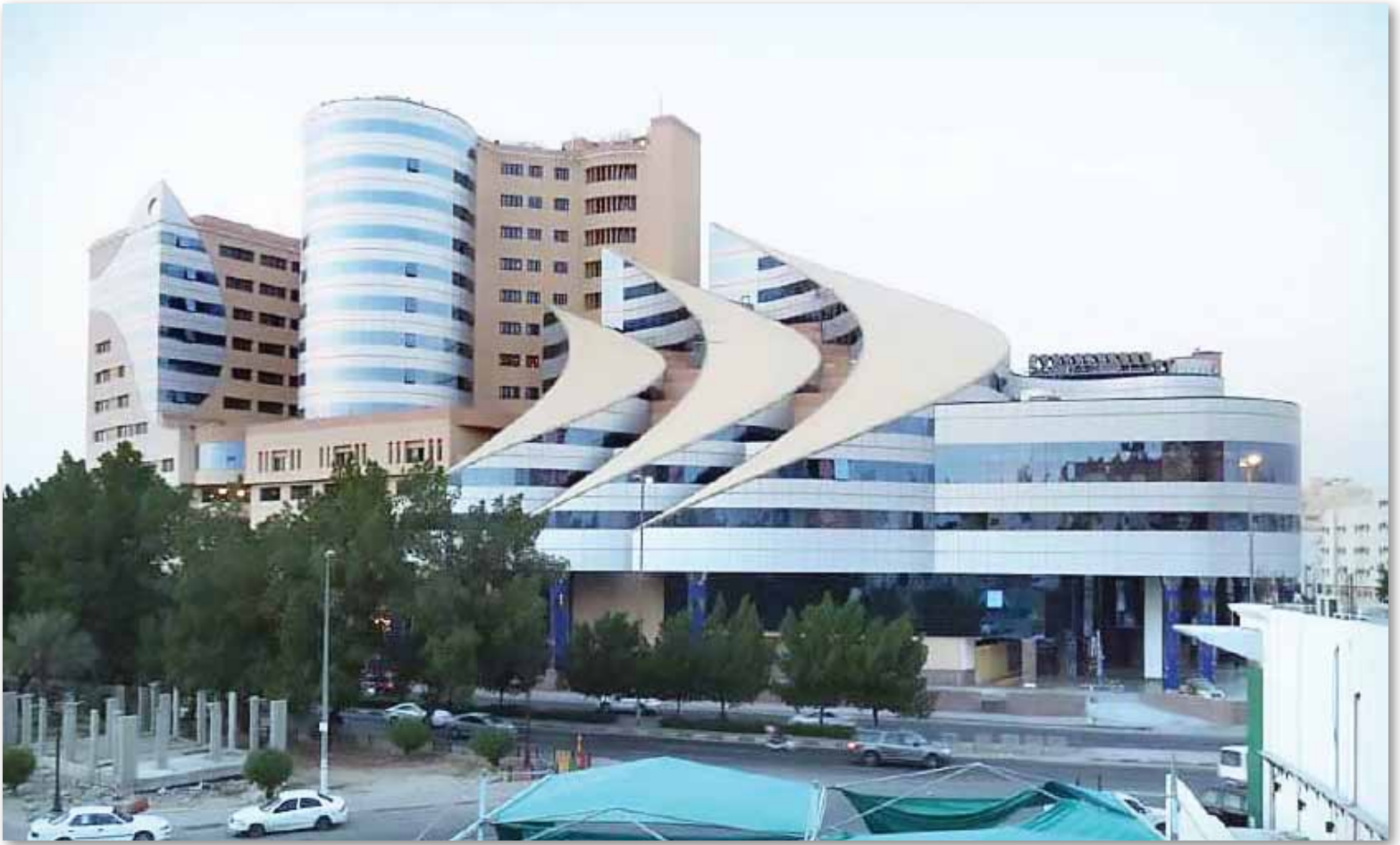
مشروع الأهلة الذي أصبح معلماً بارزاً من معالم العاصمة المقدسة