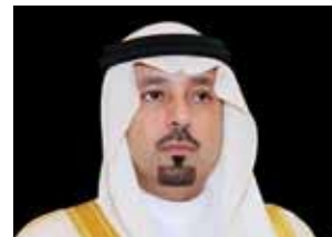
سمو الأمير مشعل بن عبد الله

كما اطلع سمو أمير مكة على ما تقوم به هيئة الاتصالات وتقنية المعلومات من أعمال وجهود لتوفير خدمات الاتصالات وتقنية المعلومات الثابتة والمتنقلة ونقل البيانات ونشر الشبكة والتغطية لكل التجمعات السكانية في منطقة مكة المكرمة وكافة أرجاء المملكة.. جاء ذلك خلال استقبال سموه أيضا في مكتبه بجدة محافظ هيئة الاتصالات وتقنية المعلومات المهندس عبد الله بن عبدالعزيز الضراب والوفد المرافق له.