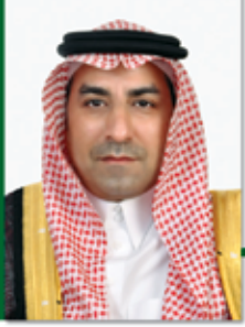
بقلم: د. رافت بن إسماعيل إبراهيم بدر •