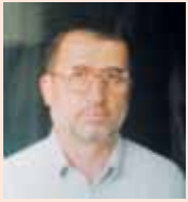
بقلم: أ.د. رياض حسن الخوارزمي

ما أجمل هذه العبارة وما أكثر ترادها على أفواه الحجاج والمعتمرين، وما أجدرنا بفهمها، ومعرفة أصلها وتاريخها، لقد رصدتها اللغويون لكثرة استعمالها، فوضحوا خصائصها وبيّنوا ميزاتها قالوا: