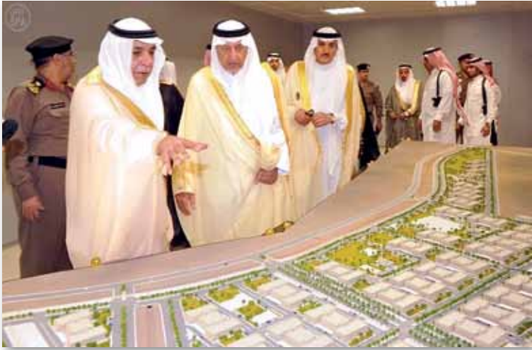
سمو الأمير خالد الفيصل أثناء الجولة

تاريخه وأبرز الملاحظات التي رصدت والمعالجات التي تمت بما يوفر لحجاج بيت الله الحرام أداء نسكهم بيسر وسهولة.