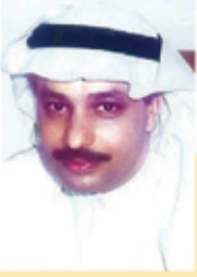
بقلم: م . عبدالله أحمد حسين